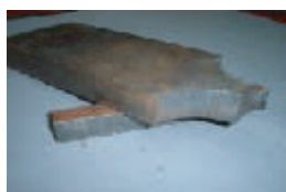
シャープでノロが少ない