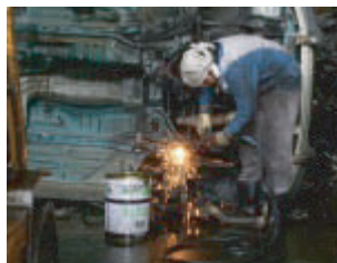
自動車解体で、廃ガソリン利用