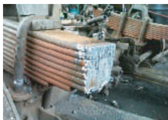
トラックのパネ切断