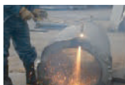
垂鉛引き切断にハネがない