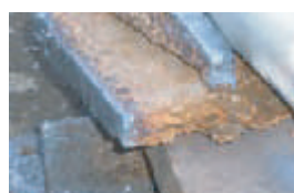
サビに強くハネが少ない